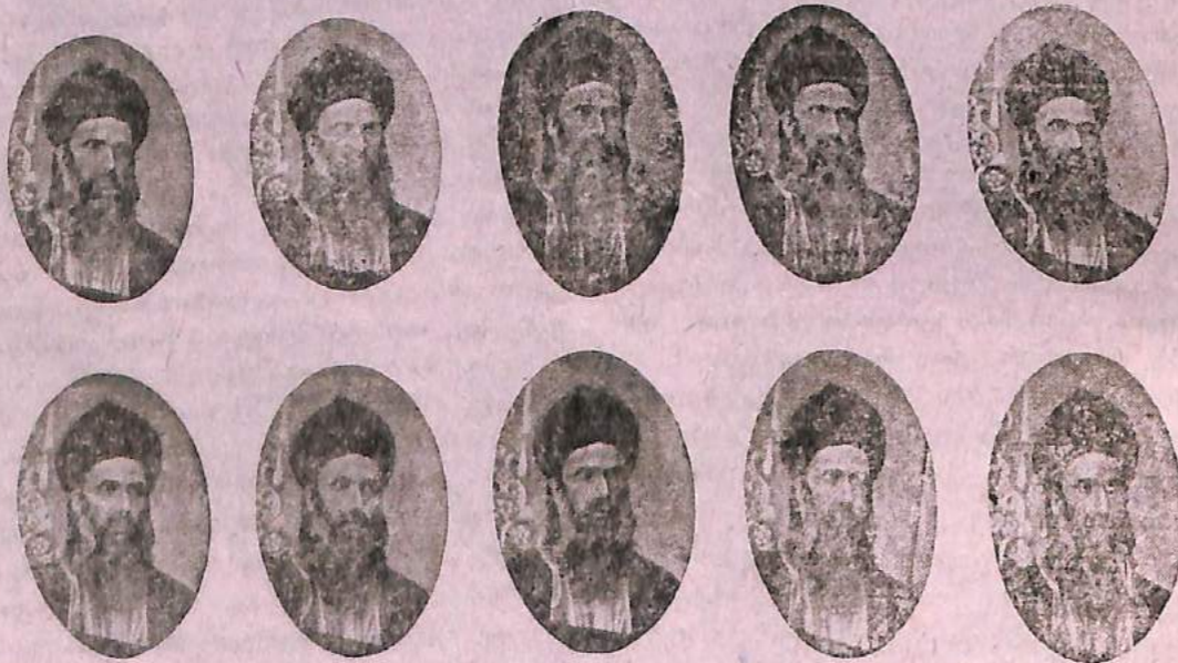
താമസിച്ചതിനു ക്ഷമാപണം—ഒരു വിശ്വാസി, കവേറ്റു്.

വുന്നവിധത്തിൽ ലളിതമാകയാൽ അവരെക്കൊണ്ടും വായിപ്പിക്കുന്നതുകൊള്ളാം. പ. സുന്നഹദോസിന്റെ ഈ തീരുമാനം ദുരവ്യാപകമായ പ്രയോജനം ചെയ്യുമെന്നതിനു തർക്കമില്ല.