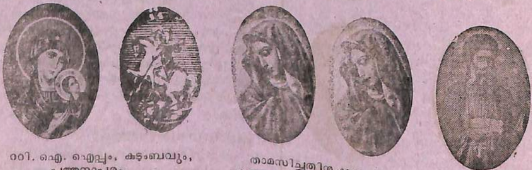
റവീ. ഐ. ഐച്ചം, കടംബവും, പത്തനാപുരം.