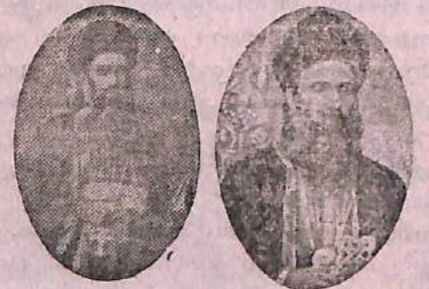
മി. ഷ. മിസ്സസ്, ഒരു വിശ്വാസി, റാ. എം. കുര്യൻ, കൽക്കട്ടാ, ചേപ്പാടു.