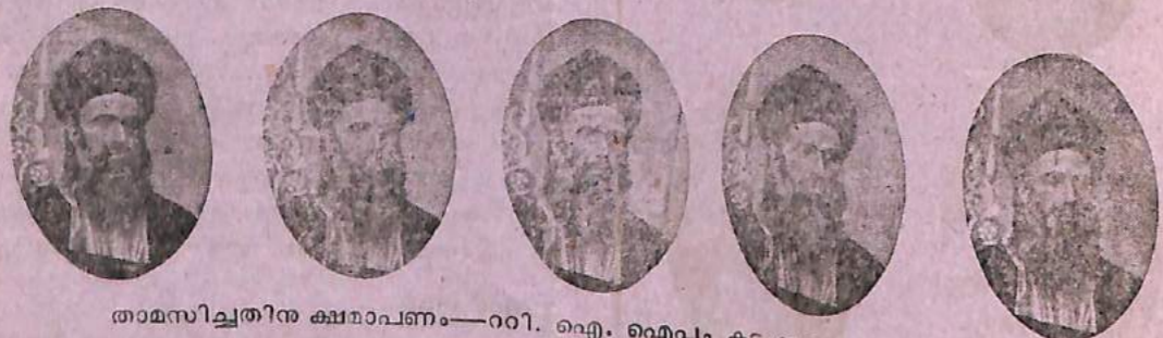
താമസിച്ചതിനു ക്ഷമാപണം—റവീ. ഐ. ഐച്ചം കടംബവും, പത്തനാപുരം.