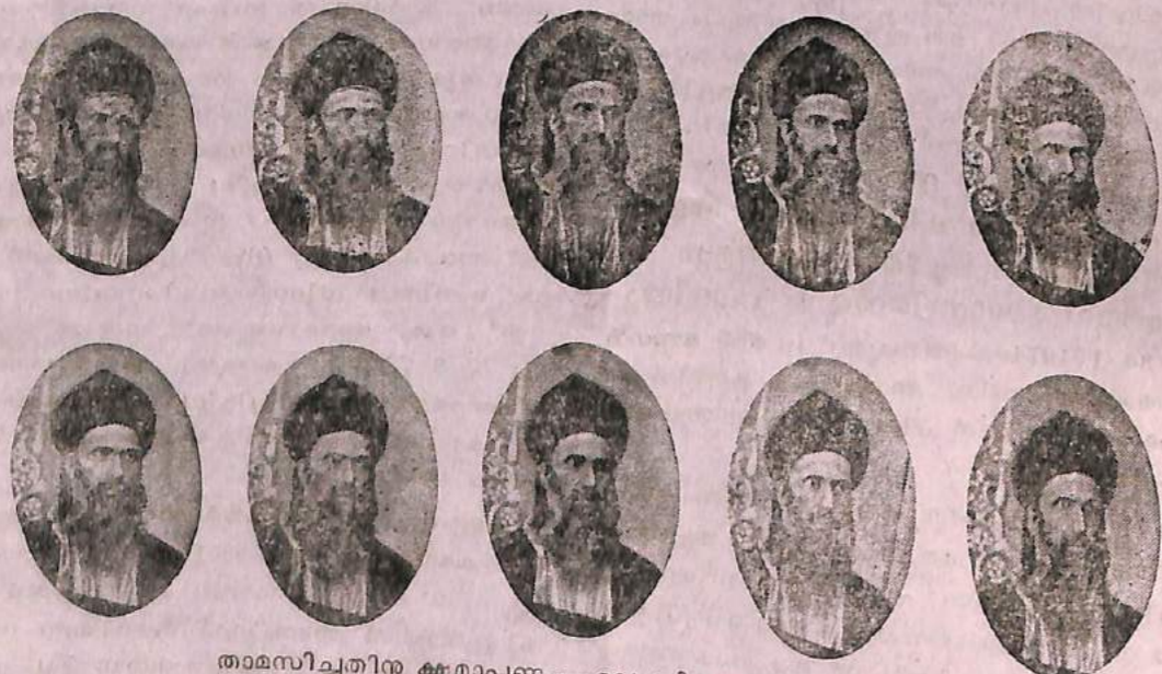
താമസിച്ചതിനു ക്ഷമാപണം.—ഒരു വിശ്വാസി, കവേററ്.