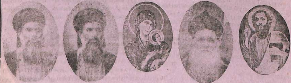
താമസിച്ച്തിരു ക്ക മാപണം- ഒരു വിശ്വാസി, കോഴിക്കോട്ടു്.