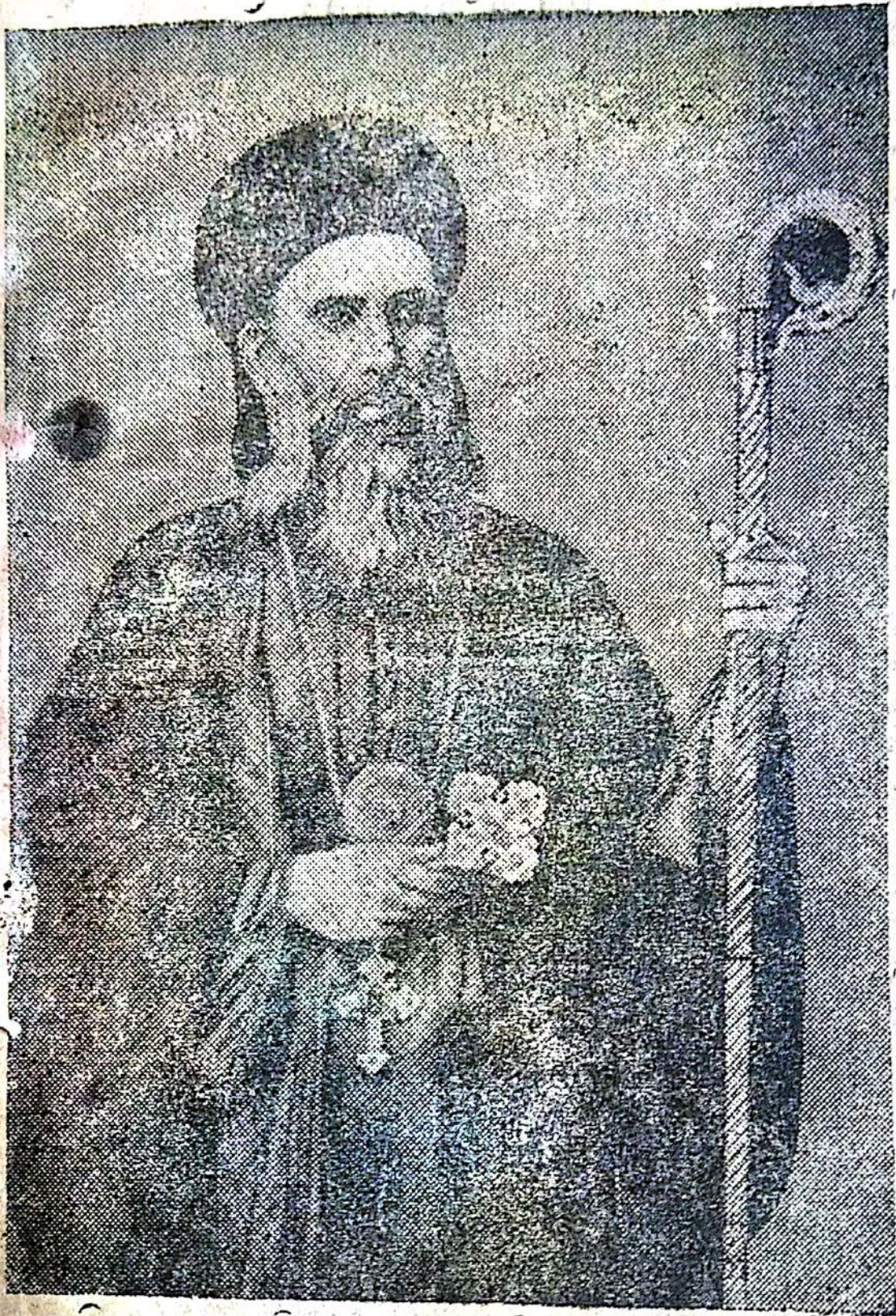
മലങ്കരയിലെ പ്രഥമ പരിശുദ്ധൻ പരമല കാലം ചെയ്ത നി. വ. ടി. ശ്രീമാൻ ഗ്രീഗോറിയോസ് തിരുമേനി.